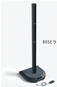
BOSEラインアレイスピーカー-L1

ラインアレイスピーカー スマートなスピーカーで威圧感を感じさせずに、会場をすっきり見せます。