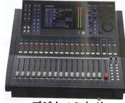
デジタルミキサー LS9