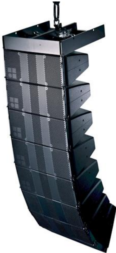
d&b T-Series T10 Line Array